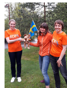
The team at AcureOmics.