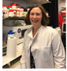
Professor Sara E. Mole

Le but de BATCure était d'étudier l'histoire naturelle de trois types de maladie de Batten, de fournir de nouveaux modèles de recherche, d'élucider la fonction des protéines clés, de déterminer les mécanismes de la maladie, et de développer de nouveaux traitements. L'ensemble du projet a été coordonné par le professeur Sara Mole de l'UCL.