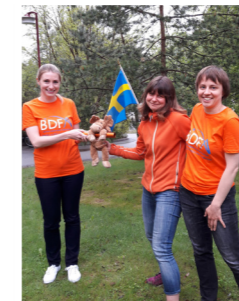
The team at AcureOmics.

AcureOmics est une société basée en Suède spécialisée dans l'utilisation de la métabolomique pour identifier les perturbations des voies biochimiques. Les connaissances acquises sur les maladies CLN3, CLN6 et CLN7 servent à la fois à évaluer et à concevoir de nouveaux traitements et contribueront à améliorer la surveillance des effets des traitements en cours.